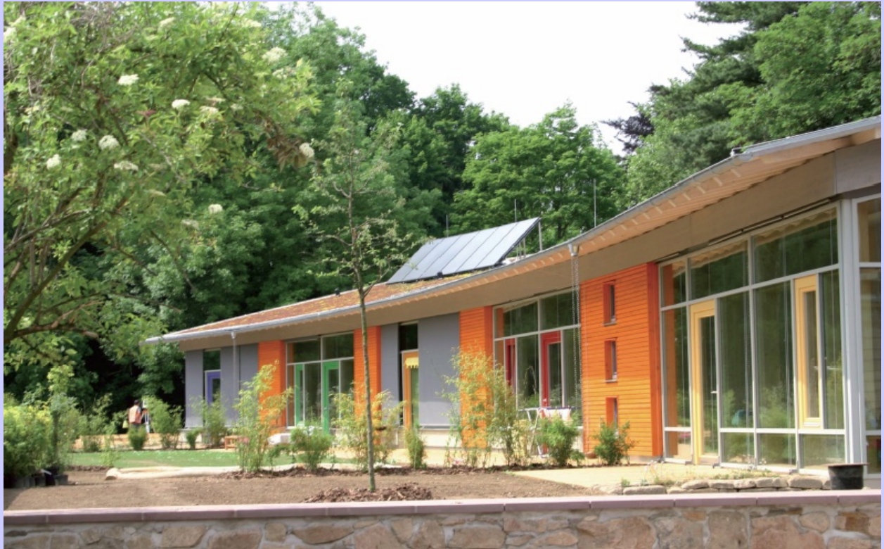
Kindergarten Döbeln, Architektengemeinschaft Reiter und Rentzsch

Veranstaltungsort: Rathaus, Markt 1, Jena Termin: 04.Juli - 29.Juli 2011